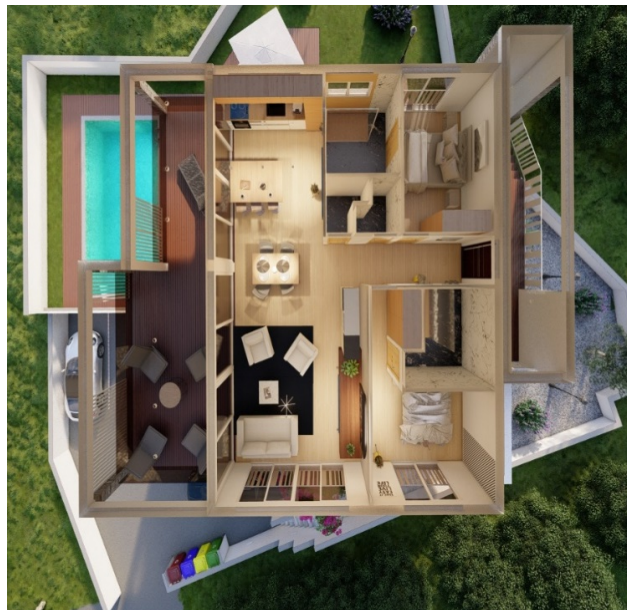
Meerblick vom Penthouse